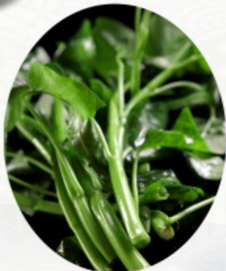
S9 蒜茸空心菜 20 CHF Liseron d'eau sauté à l'ail Sautéed water spinach with garlic