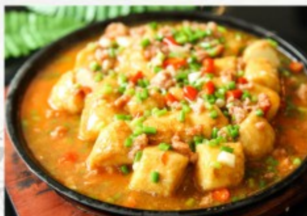
C21 铁板豆腐 24 CHF Tofu grillé sur lit d'oeuf et ardoise Grilled Tofu on egg bed with hot plate