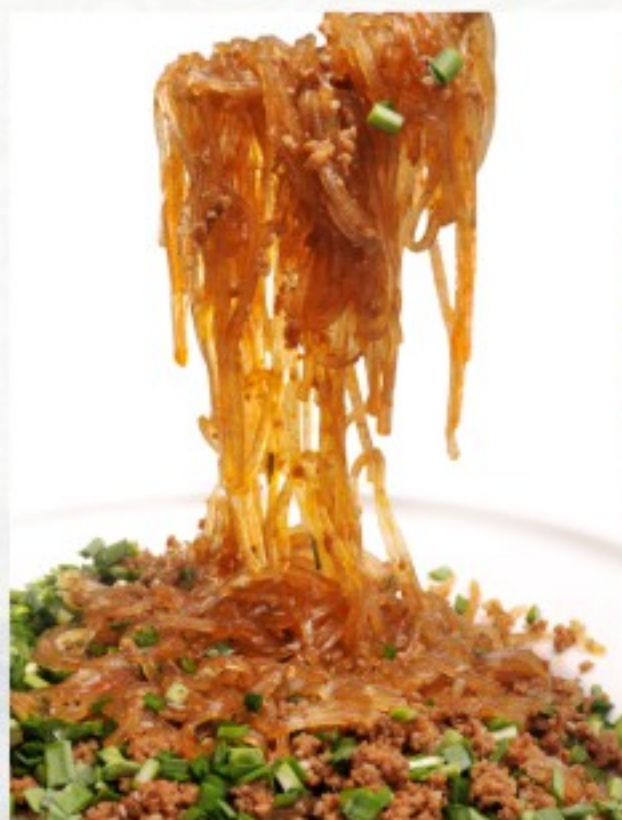
C19 蚂蚁上树 22 CHF Vermicelles frits à la viande hachée Fried vermicelli with minced meat