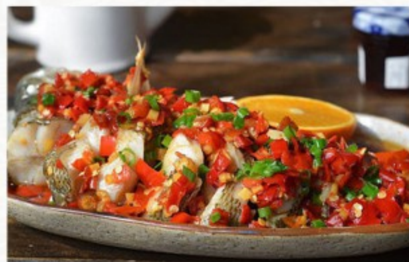
C5 川式炉鱼 Loup de mer grillé façon Sichuannais Szechuan-style Grilled Sea-bass 38 CHF (300g / 400g) 68 CHF (600g / 800g)