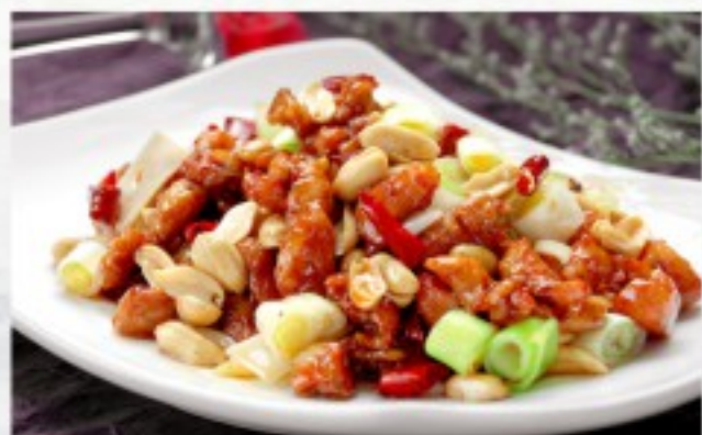
R23 宫保鸡 24 CHF Poulet Gong Bao Gong Bao Chicken