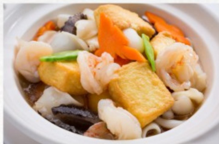
R10 海鲜豆腐煲 32 CHF Marmite de fruits de mer au tofu Clay pot Seafood and Tofu