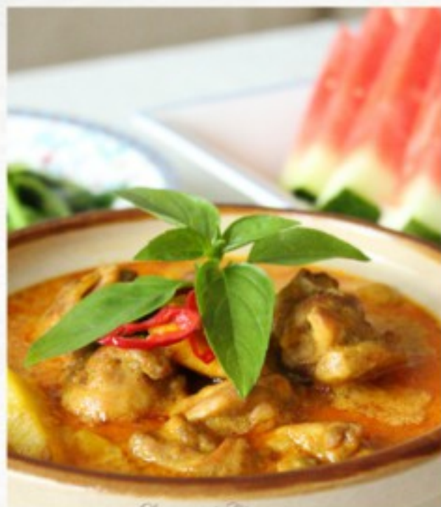
R18 泰式咖喱牛 25 CHF Boeuf au curry, façon Thai Beef curry, Thai-style