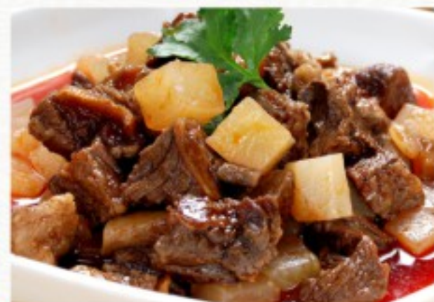
C11 萝卜烧牛腩 32 CHF Ragoût de boeuf et radis blancs à la sauce épicée Spicy beef stew with daikon radish