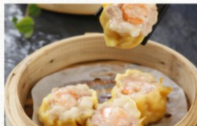
D8 烧麦 (4只) 12 CHF Shao-mai au porc et crevette à la vapeur (4 pcs) Steamed shao-mai with pork and shrimps (4 pcs)