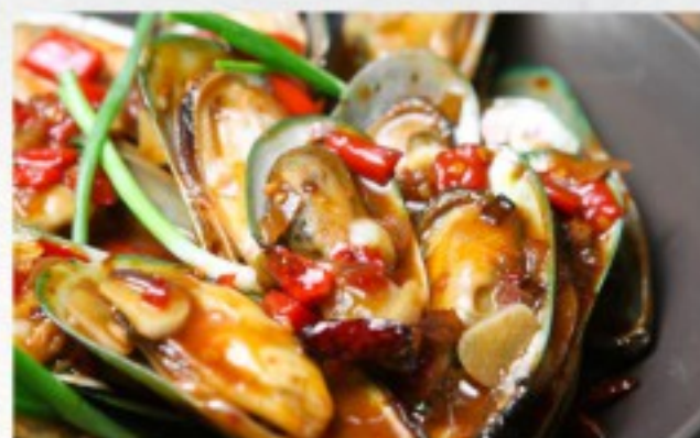
C4 川味炒青口 26 CHF Moules épicées Sichuannais Szechuan-style spicy mussels