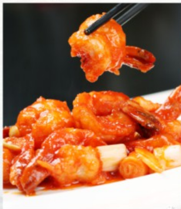
R16 咕老虾 25 CHF Crevettes à la sauce aigre-douce Sweet and sour shrimps