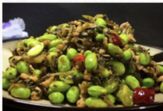
S12 雪菜毛豆 22 CHF Haricots chinois sautés aux légumes marinés Chinese beans sautéed with pickled vegetables