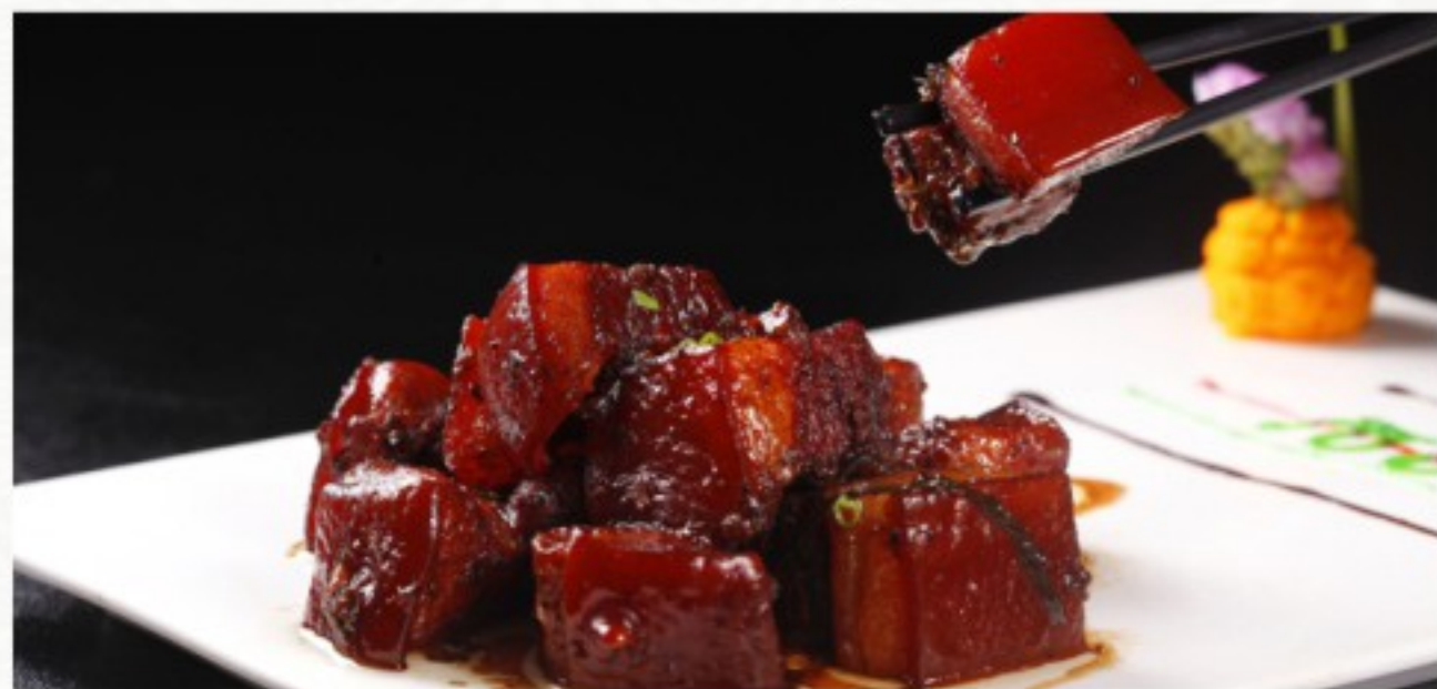
C14 宫廷红烧肉 28 CHF

Brochette d'agneau au grill ( 5 pcs ) Chef's style Roast Lamb