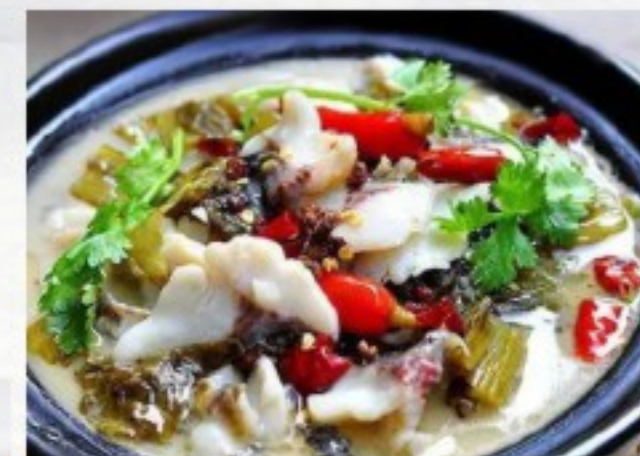
C8 酸菜鱼 38 CHF Poisson à la choucroute marinée façon du chef Chef's style Pickled Sauerkraut with Fish