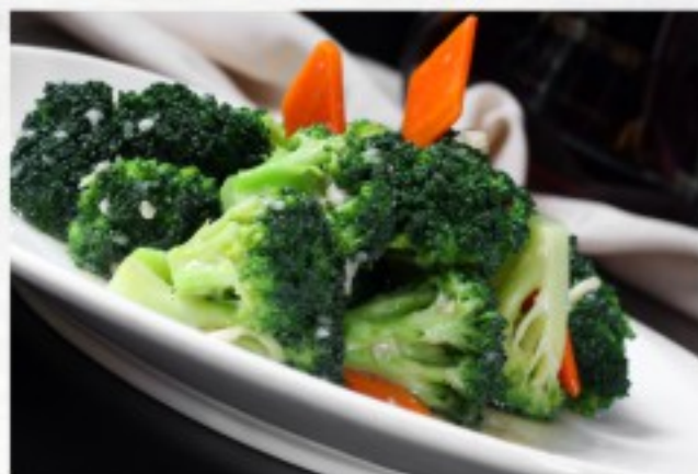
S10 蒜茸西兰花 18 CHF Brocoli sauté à l'ail Sautéed broccoli with garlic