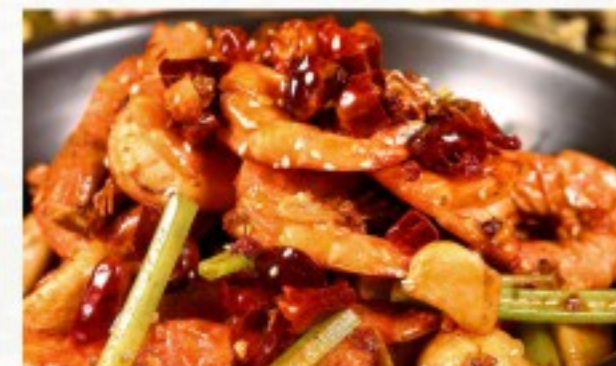
R13 干锅虾 28 CHF Crevettes sautées façon du chef Chef's Special spicy stir-fried shrimps