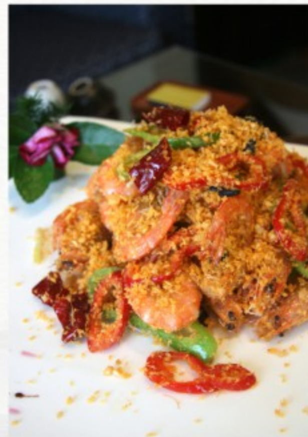
R12 避风塘炒虾 32 CHF Crevettes panées à l'ail et piment Deep-fried prawns with crispy garlic and chili