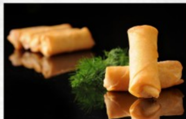
D6 脆皮春卷 (2条) 8 CHF Rouleaux de printemps aux légumes (2 pcs) Vegetarian spring rolls (2 pcs)