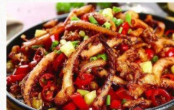
R7 铁板鱿鱼 22 CHF Calamars sauté façon du chef sur ardoise Calamari sautéed on a hot plate