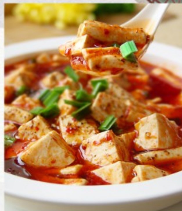
C20 麻辣豆腐 23 CHF Ma Po Tofu à la viande hachée Mapo Tofu with minced meat