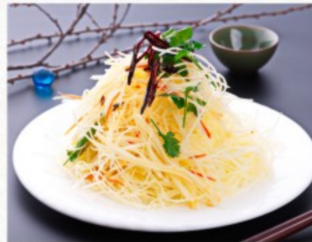
L4 凉拌土豆丝 18 CHF Salade de pomme de terre Potato salad