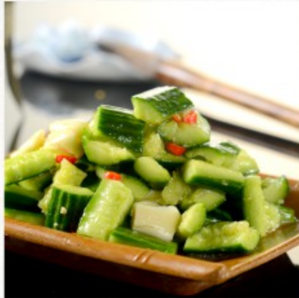
L3 蒜拌黄瓜 14 CHF Concombre à l'ail Cucumber with garlic