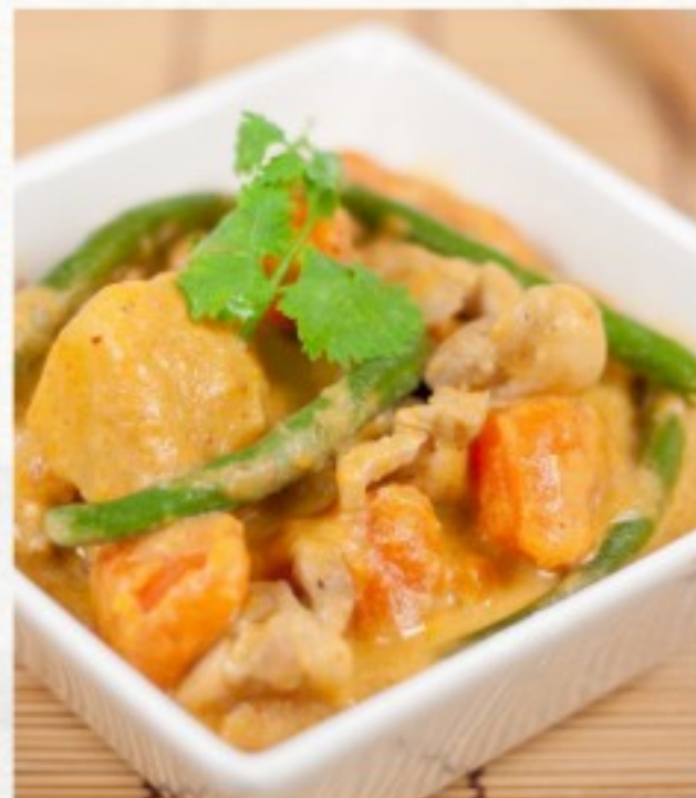
R17 泰式咖喱鸡 24 CHF Poulet au curry, façon Thai Chicken curry, Thai-style