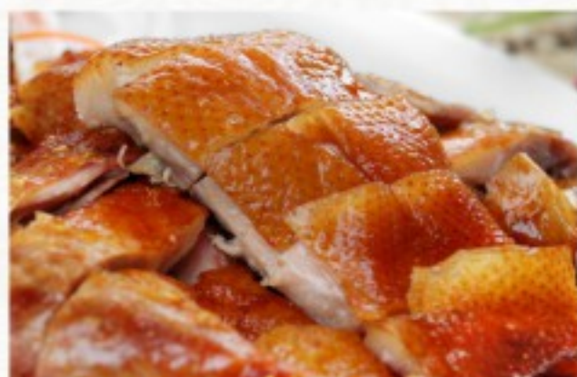
R2 广东烧鸭 25 CHF Canard rôti à la cantonnaise Cantonese Roast Duck