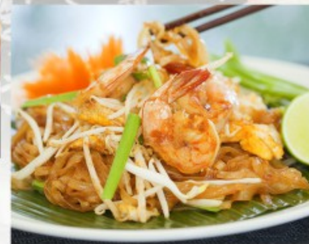
F2 干炒虾河 23 CHF Pâtes de riz sauté aux crevettes Wok-fried shrimps rice noodles