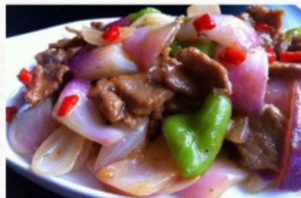
R26 洋葱炒牛肉 24 CHF Boeuf aux oignons Beef with black onions