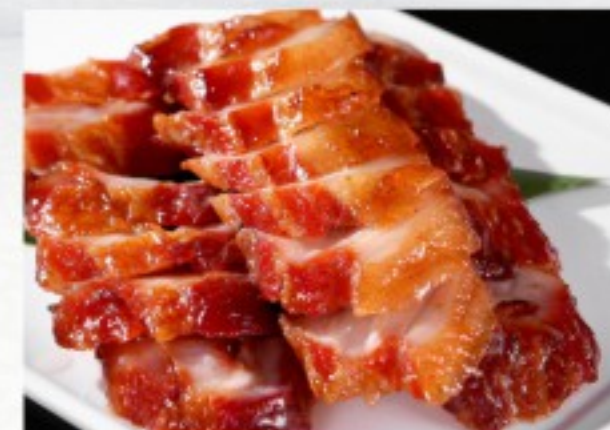
C17 蜜汁叉烧 28 CHF

Porc sauté façon Sichuannais Szechuan-style Sautéed Pork