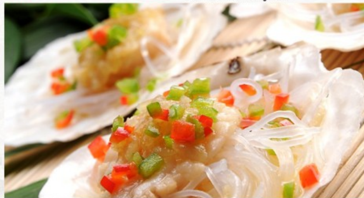
C1 蒜蓉粉丝蒸扇贝 38 CHF Saint-Jacques à la vapeur sur lit de vermicellés et avec sa sauce à l'ail Steamed Scallops on vermicelli and garlic sauce