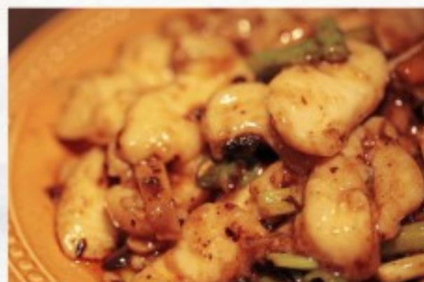
R28 豆豉鱼 22 CHF Poisson aux haricots noirs Fish with black beans sauce