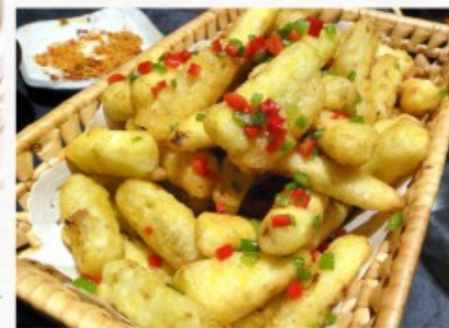
S6 椒盐茄子 24 CHF Aubergine croustillante panée au sel et poivre Crispy Eggplant with Salt and Pepper