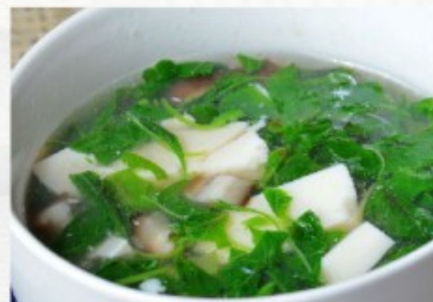
P4 蔬菜豆腐羹 10 CHF Potage de tofu et légumes Minced tofu and vegetable soup