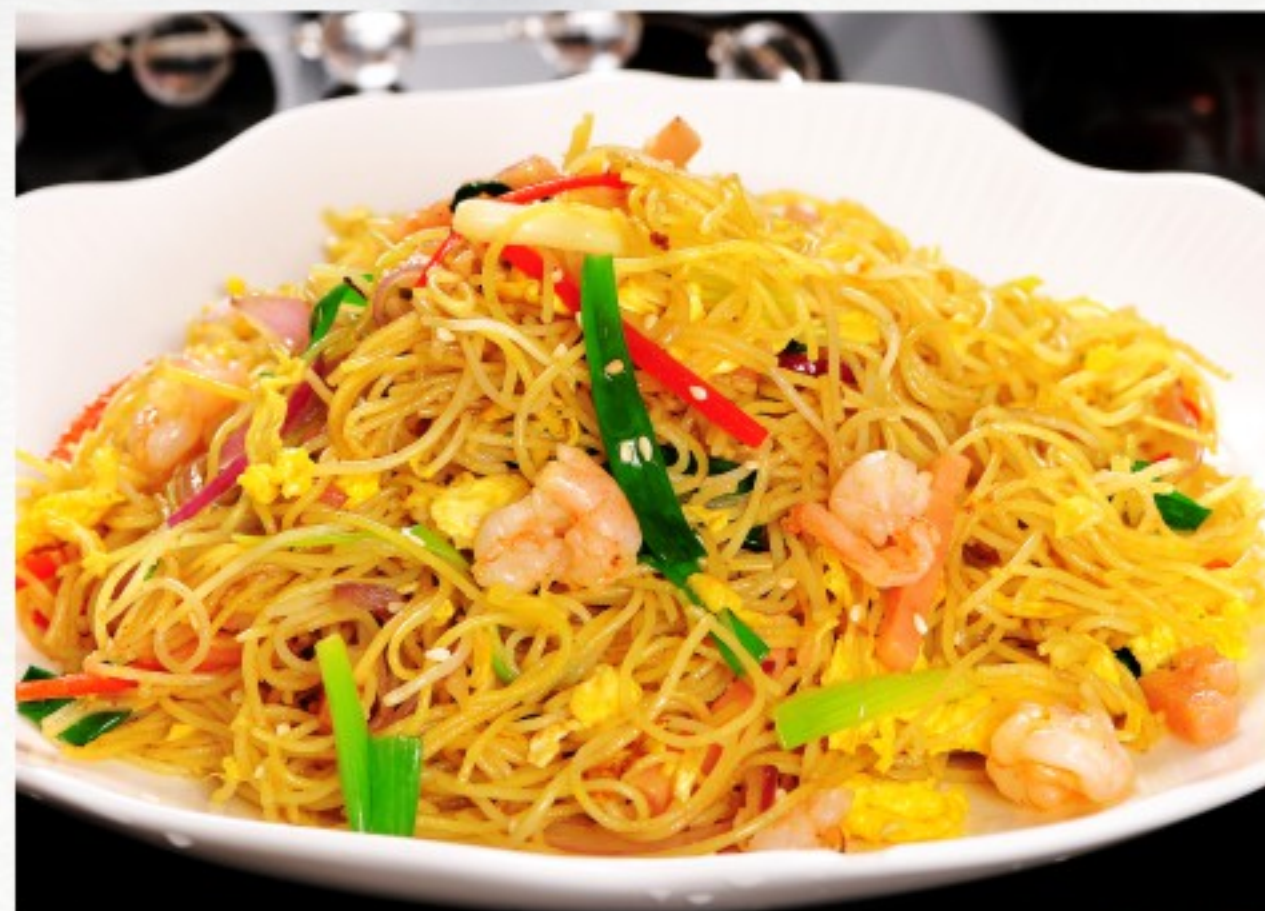
F3 星洲炒米粉 24 CHF Vermicelles sautées façon Singapour Singapore fried noodles