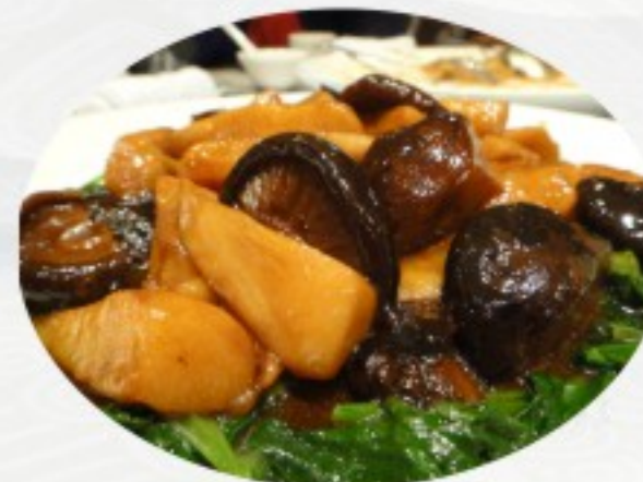
S3 炒双冬 20 CHF Champignons chinois aux pousses de bambous Chinese mushrooms with bamboo shoots