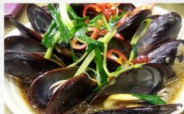
C3 姜葱炒青口 26 CHF Moules sautées au gingembre et poireaux Mussels Sautéed with ginger and leek