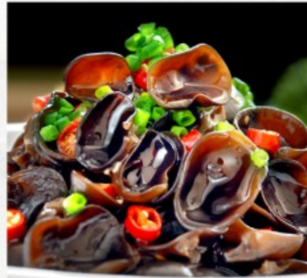
L2 老醋木耳 16 CHF Champignons chinois à la sauce au vinaigre Chinese mushrooms in vinegar sauce