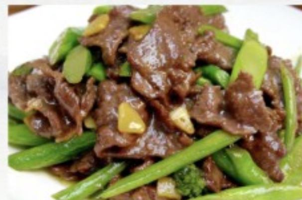
R29 时菜牛 24 CHF Boeuf sauté aux légumes Sautéed Beef with vegetable