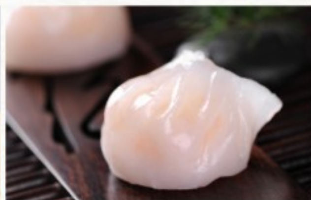
D9 水晶虾饺 (5只) 12 CHF Raviolis aux crevettes (5 pcs) Steamed shrimp dumplings (5 pcs)