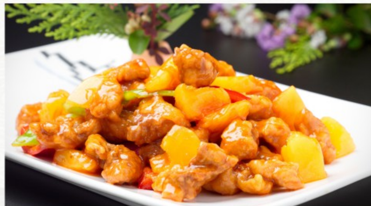
C15 糖醋里脊 24 CHF

Porc bouillons au marmite Braised pork with spices