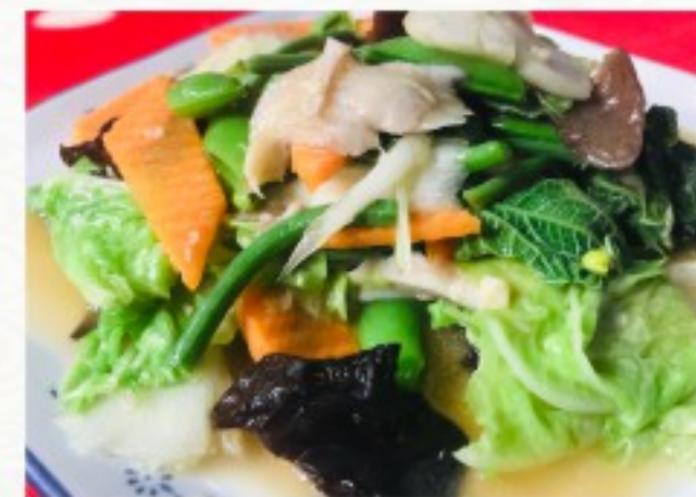
S2 炒什锦 18 CHF Légumes mixte Mixed Chinese Vegetables