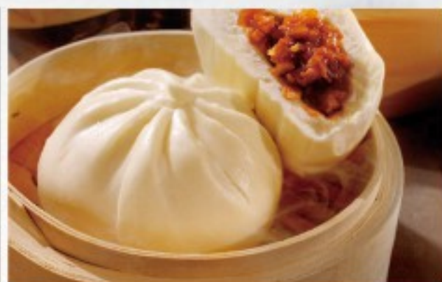
D7 发面肉包 (2只) 10 CHF Bun au viande de porc (2 pcs) Pork bun (2 pcs)