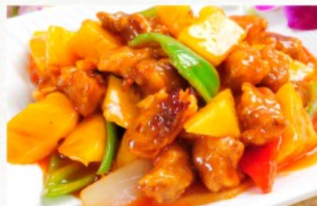
R3 菠萝鸭 25 CHF Canard à la sauce aigre-douce Sweet and sour duck