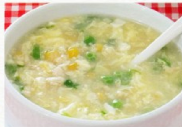
P2 鸡茸玉米汤 10 CHF Potage au poulet et maïs Chicken and sweet corn soup