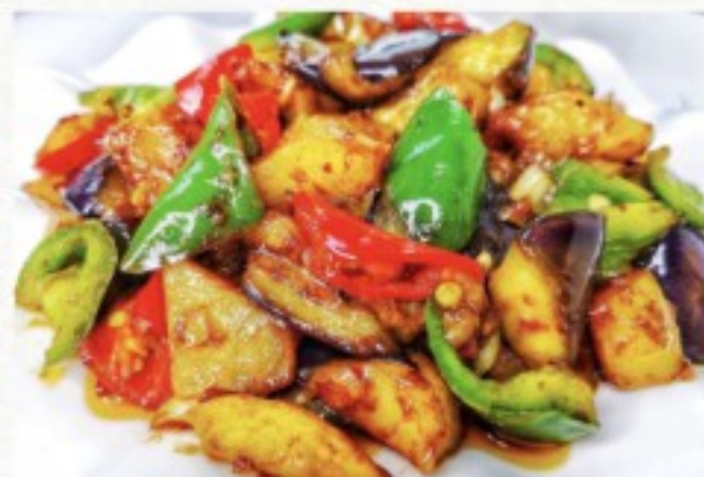
S13 地三鲜 20 CHF Légumes de la ferme du chef Vegetables from the chef's farm