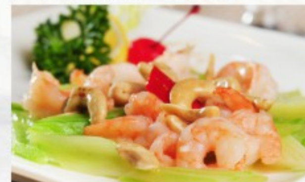
R14 腰果虾球 25 CHF Crevettes sautées au noix de cajou Sautéed Shrimp with Cashew Nuts