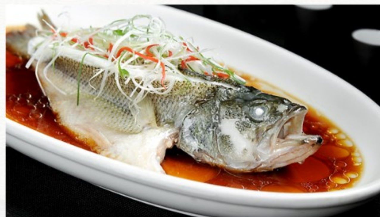
C6 清蒸鲈鱼 38 CHF (300g / 400g) Loup de mer cuit à la vapeur 68 CHF (600g / 800g) Steamed Sea-bass