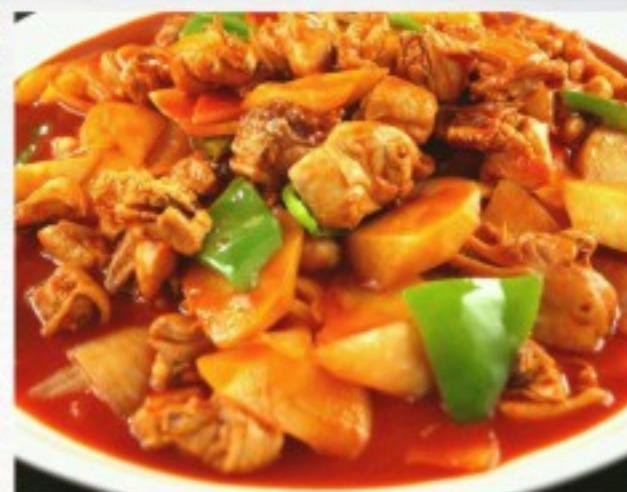
C22 大盘鸡 32 CHF Poulet braisé façon du chef Chefs style Braised Chicken