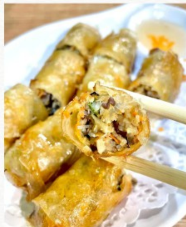
D3 越南鸡肉卷 (3条) 12 CHF Nem au poulet (3 pcs) Vietnamese chicken spring rolls (3 pcs)