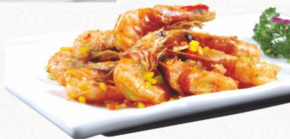
R11 椒盐大虾 32 CHF Crevettes géantes poêlées au sel et au poivre Pan-fried Jumbo shrimps with salt and pepper