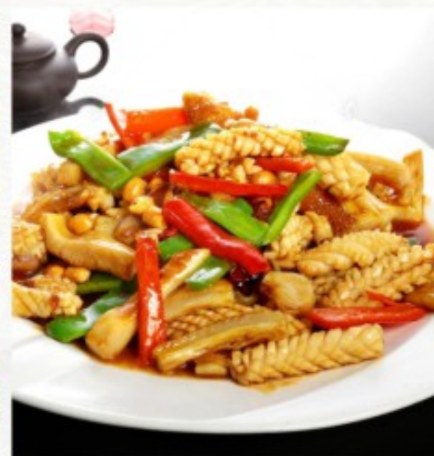
R9 宫保鱿鱼 23 CHF Calamars Gong Bao Gong Bao Calamari