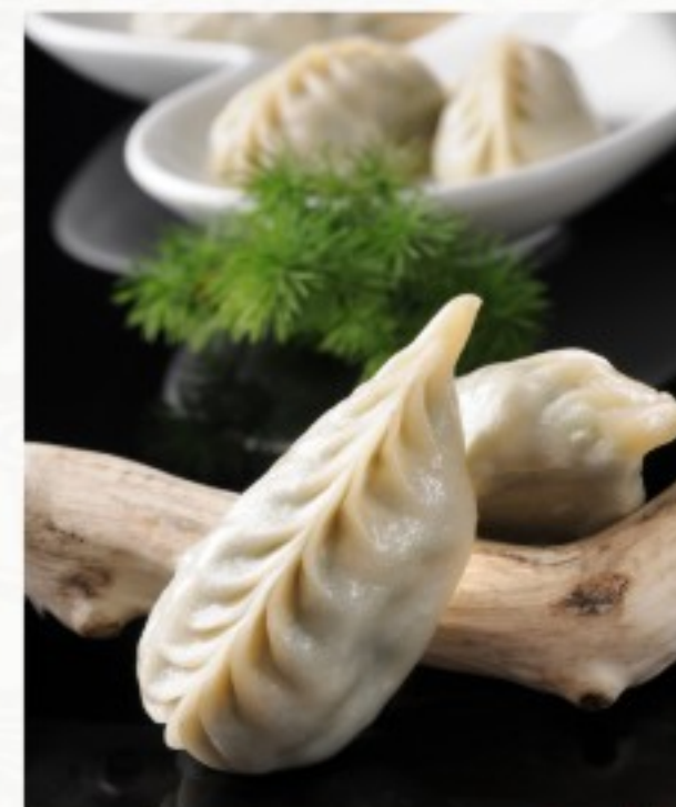
D4 蒸素饺 (5只) 10 CHF Raviolis à la vapeur aux légumes (5 pcs) Steamed vegetable dumplings (5 pcs)