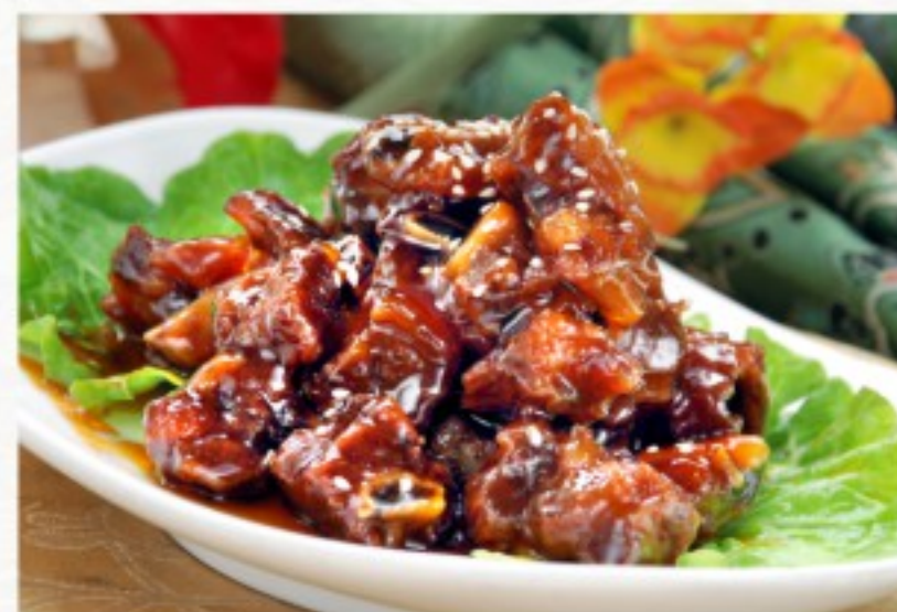
C18 糖醋排骨 26 CHF

Porc laqué au miel Lacquered pork in honey