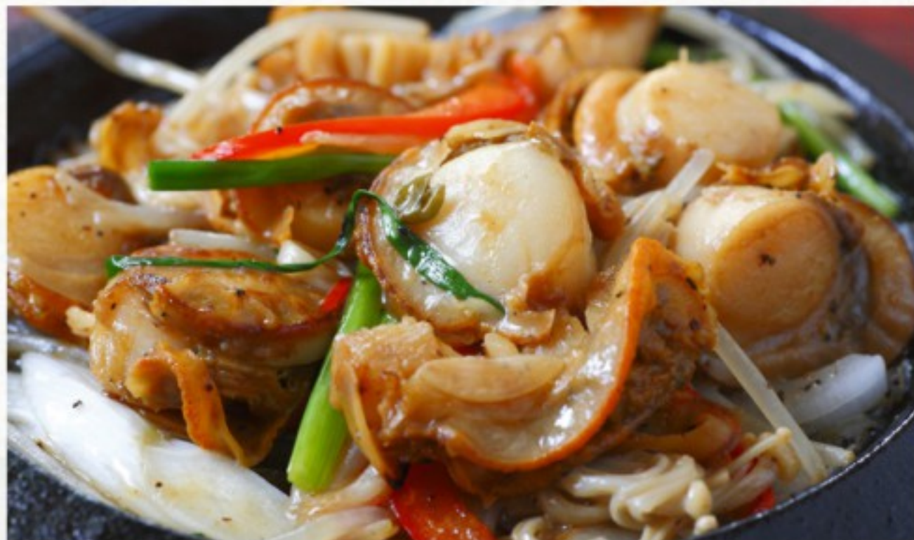
C2 铁板黑椒扇贝 32 CHF Saint-Jacques aux poivrons sur ardoise Scallops with black pepper on sizzling hot plate