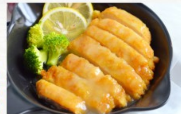
R6 柠檬鸡 23 CHF Poulet au citron Lemon Chicken