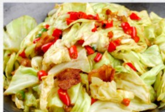
S11 干锅手撕牛心菜 28 CHF Choux pointu grillé au lard piquant Roasted Pointed cabbage with bacon