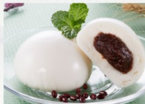
D12 豆沙包 (2只) 10 CHF Bun à la purée d'haricots rouges (2 pcs) Bun with mashed red beans (2 pcs)