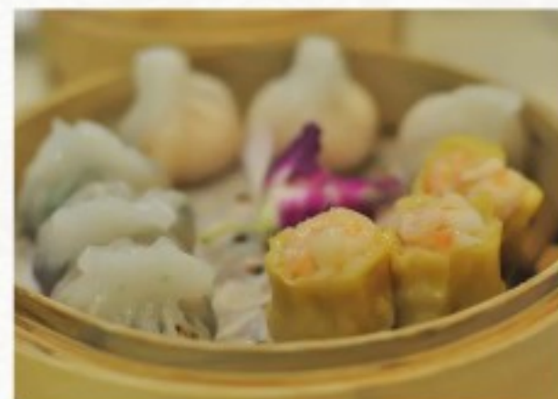
D14 点心拼盘 (8只) 24 CHF Délices à la vapeur mixte (8 pcs) Mixed steam dumplings (8 pcs)