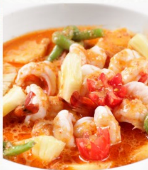
R19 泰式咖喱虾 25 CHF Crevettes au curry, façon Thai Shrimps curry, Thai-style