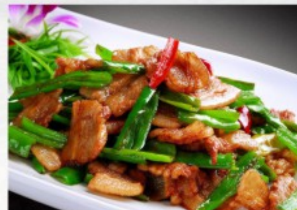
C16 湘味小炒肉 25 CHF

Porc à la sauce aigre-douce Sweet and sour Pork