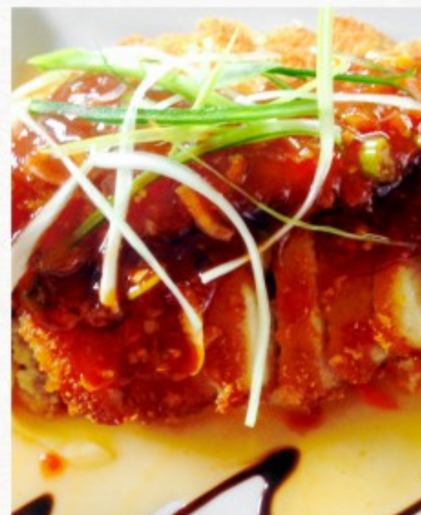
R5 柠檬鸭 25 CHF Canard au citron Lemon Duck