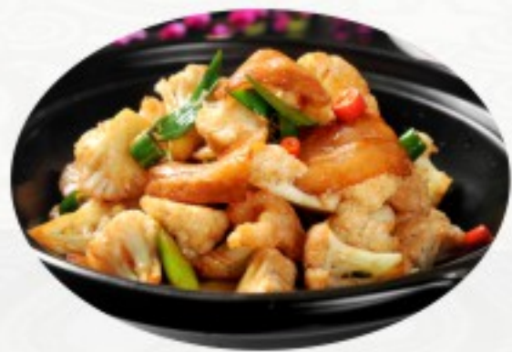
S8 干锅花菜 24 CHF Chou-fleur grillé au lard Roasted Cauliflower with bacon