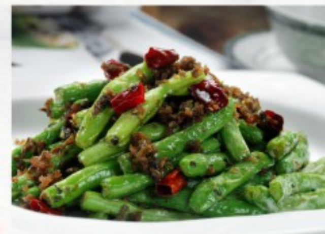
S4 干煸豆角 22 CHF Haricots verts sauté à viande hachée Sautéed green beans with minced meat