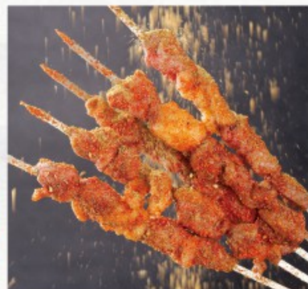
C13 羊肉串 (5串) 30 CHF

Agneau sauté au cumin Lamb Sautéed with Cumin