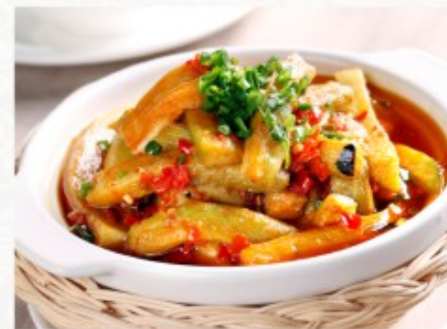
S5 茄子煲 24 CHF Aubergine braisée au haché de boeuf Braised Eggplant with minced beef