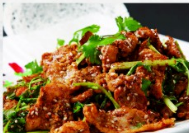
C12 孜然羊肉 36 CHF

Boeuf bouilli Sichuannais Szechuan-style boiled beef