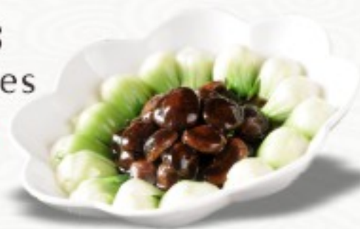
S7 香菇扒唐菜 21 CHF BaiCai braisés aux champignons chinois Braised BaiCai with Chinese Mushrooms