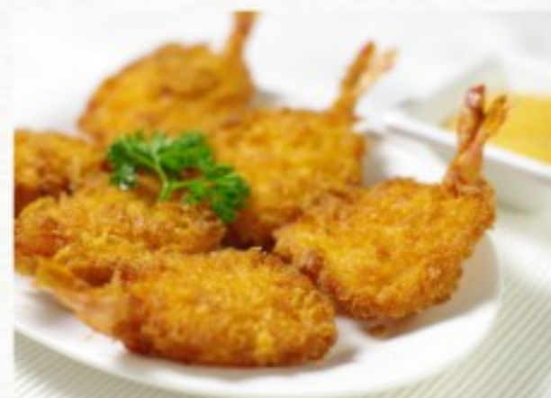
D10 蝴蝶炸虾 (6只) 15 CHF Crevettes géantes en papillon (6 pcs) Butterfly prawns (6 pcs)