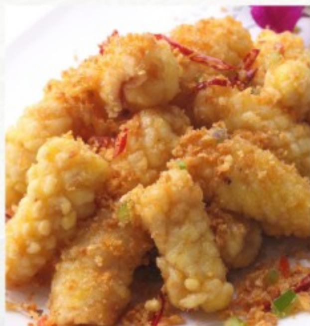
R8 椒盐鱿鱼 23 CHF Beignets de Calamars au sel et poivre Stir-fried calamari with salt and pepper