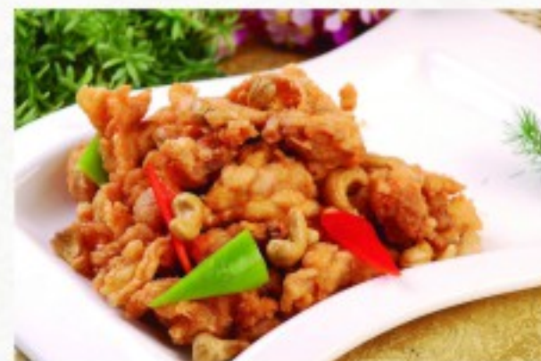
R27 香辣鸡 24 CHF Poulet épicé au caramel Chicken with spicy caramel sauce