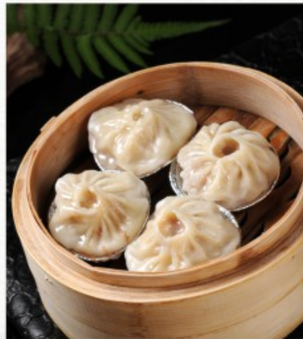
D1 小笼包 (4只) 12 CHF Xiao long bao (4 pcs) Xiao Long Bao (4 pcs)