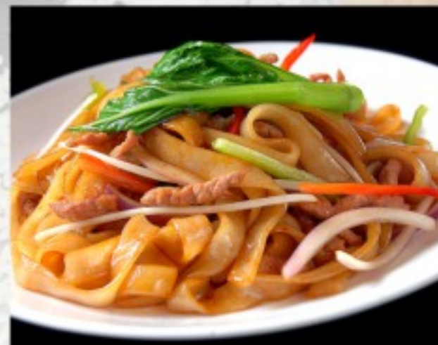
F1 干炒牛河 22 CHF Pâtes de riz sauté au boeuf Wok-fried beef rice noodles