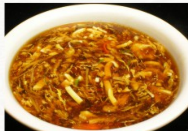
P6 酸辣汤 10 CHF Potage aigre-piquant Hot and sour soup