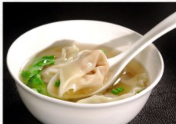
P5 馄饨汤 12 CHF Potage aux raviolis Won Ton Soup