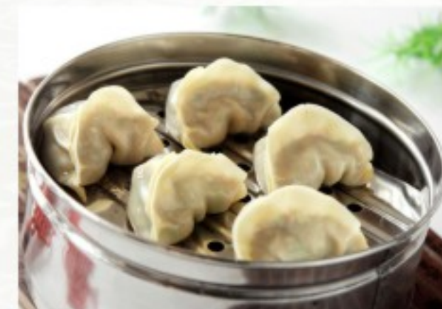
D11 蒸肉饺 (5只) 12 CHF Raviolis à la vapeur au viande de porc (5 pcs) Steamed pork dumplings (5 pcs)