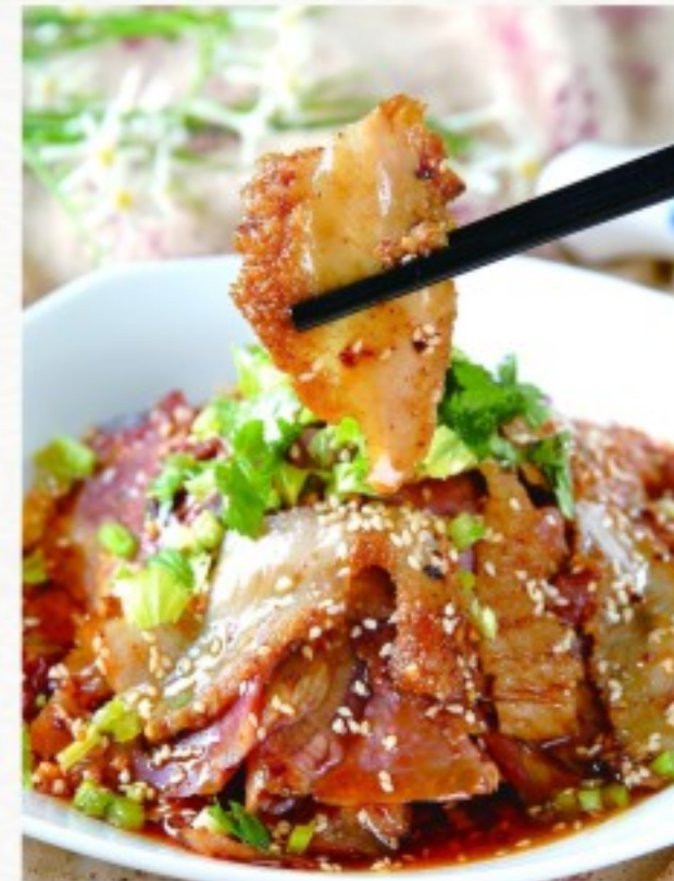
L6 夫妻肺片 26 CHF Lamelles de boeuf avec ces tripes aux épices Beef slices with spicy tripe