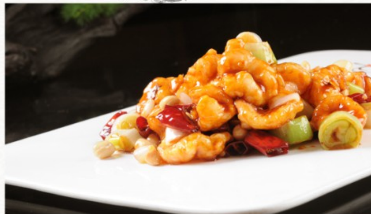
R15 宫保虾球 25 CHF Crevettes Gong Bao Gong Bao Shrimps