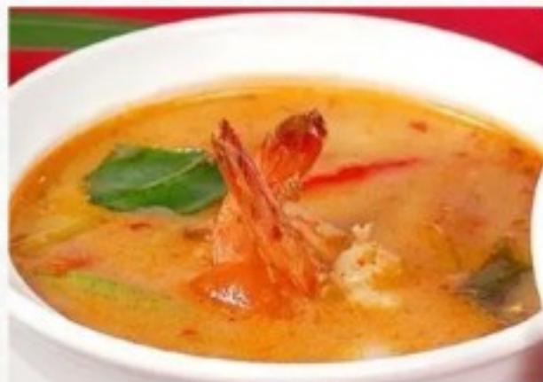
P1 冬荫汤 12 CHF Potage tong ying aux crevettes Hot and sour soup with shrimps