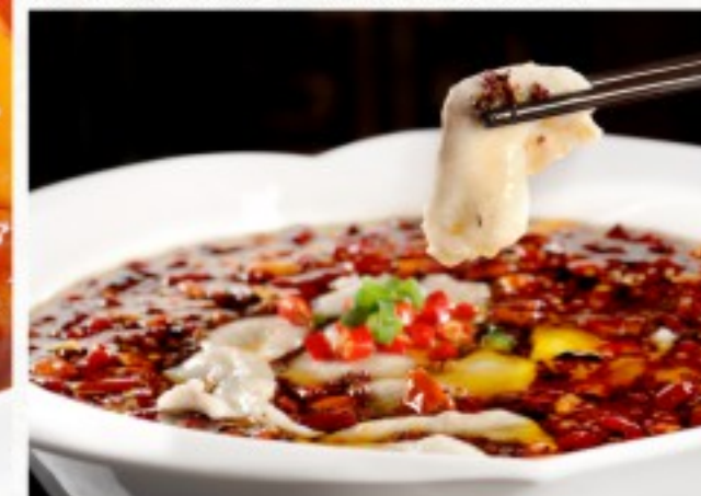
C9 重庆水煮鱼 38 CHF Poisson bouilli Sichuannais Szechuan-style boiled fish