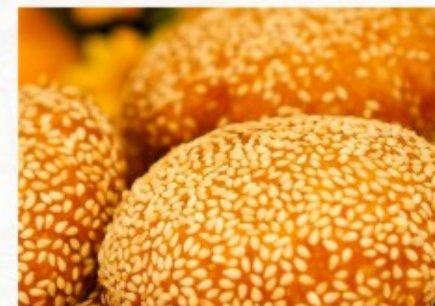
D15 豆沙南瓜饼 (3只) 12 CHF Galette de citrouille farcie à la purée d'haricots rouges Pumpkin Pancake stuffed with mashed red beans