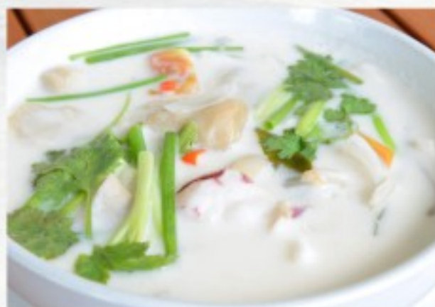
P3 椰奶鸡汤 10 CHF Potage au poulet avec du lait de coco Chicken and coconut cream soup