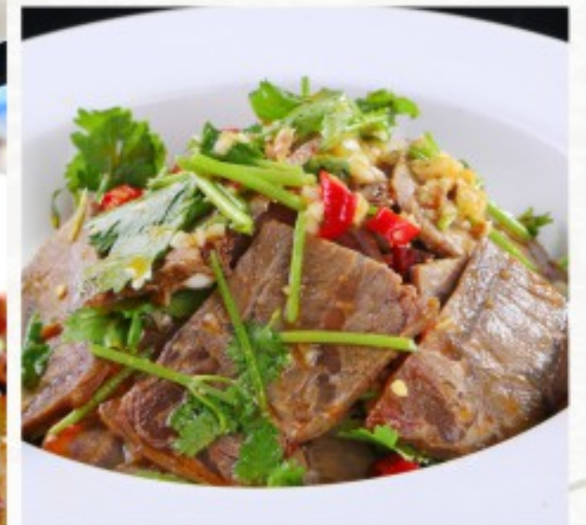
L7 富贵牛肉 26 CHF Boeuf aux cinq épices Five Spices Beef