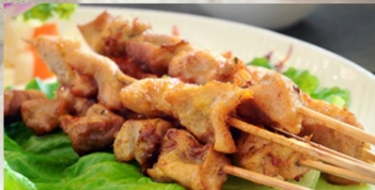
D5 沙爹鸡串 (3串) 15 CHF Brochette de poulet et sa sauce satay (3 pcs) Chicken skewers with satay sauce (3 pcs)