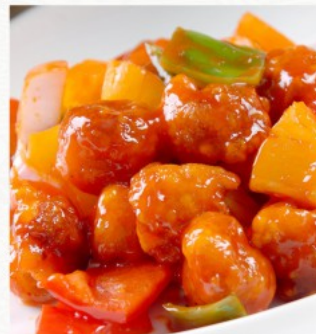
C7 甜酸鱼 21 CHF Poisson à la sauce aigre-douce Sweet and Sour Fish