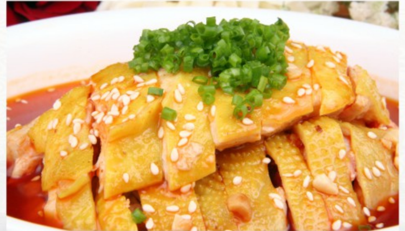
L5 口水鸡 22 CHF Poulet à la vapeur avec sa sauce chili Steamed Chicken with chili sauce