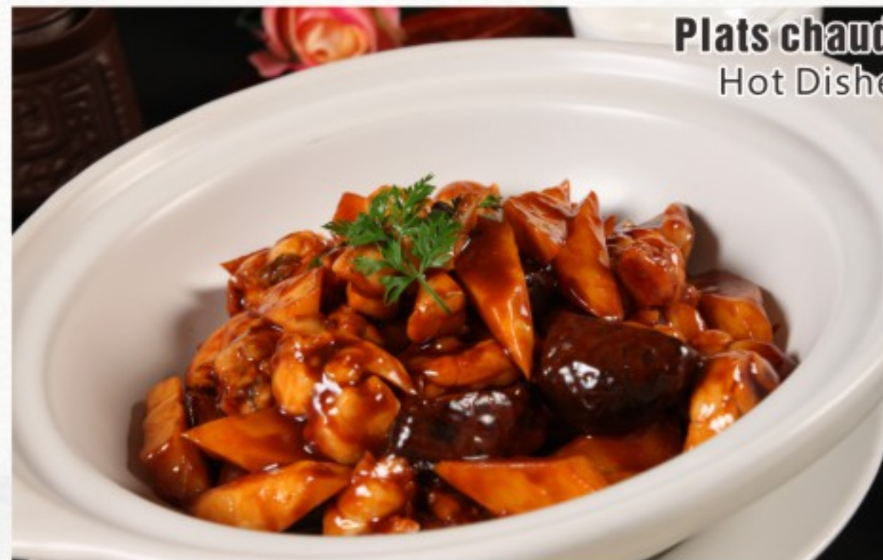
R4 双冬鸭 23 CHF Canard aux champignons et pousses de bambous Duck with mushrooms and bamboo shoots