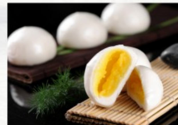
D13 奶黄包 (2只) 10 CHF Pain à la purée de lait jaune (2 pcs) Bun with creamy custard (2 pcs)