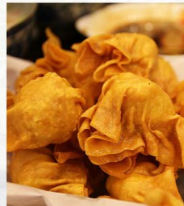
D2 酥炸云吞 (6只) 12 CHF Raviolis frits au poulet (6 pcs) Deep fried chicken dumplings (6 pcs)