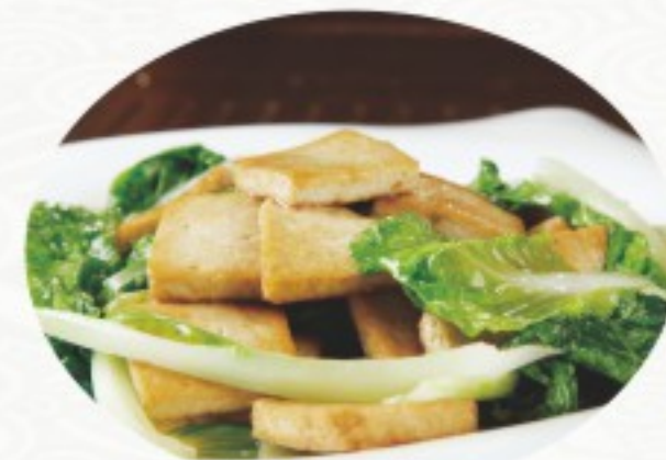
S1 什菜豆腐 22 CHF Tofu sautés aux légumes Sautéed Tofu with vegetables