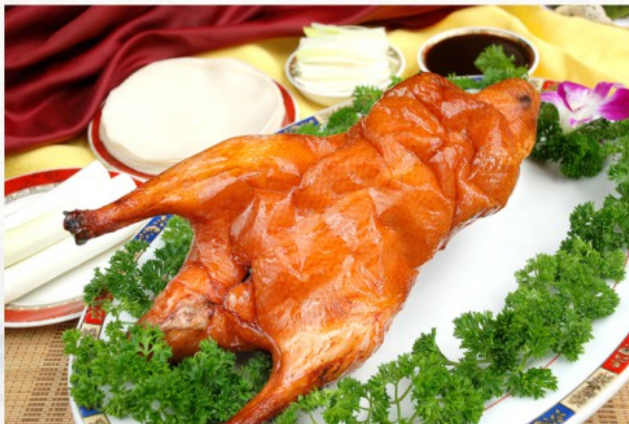
R1 北京片皮鸭 Canard laqué de Pékin, servie avec crêpes Peking duck, served with crepes