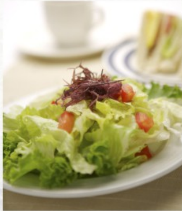
L1 绿沙拉 10 CHF Salade verte Green salad