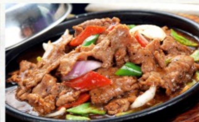
R24 铁板黑椒牛肉 26 CHF Boeuf aux poivres noirs sur ardoise Beef with black peppers on hot plate